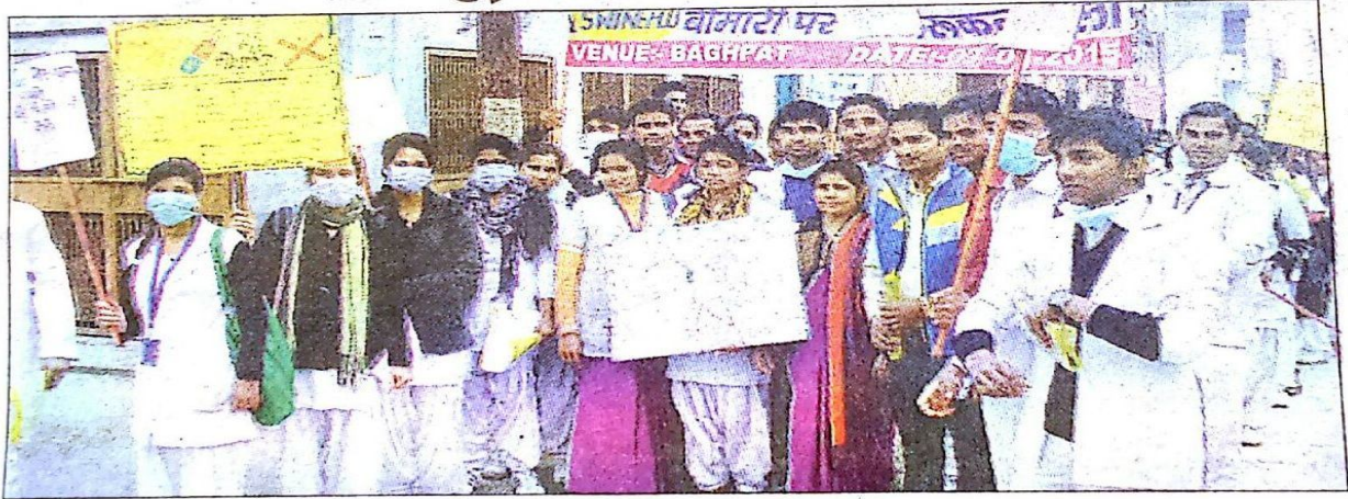
मंगलवार को बागपत के टटीरी में रैली निकालते स्यादवाद इंस्टीट्यूट के विद्यार्थी ।