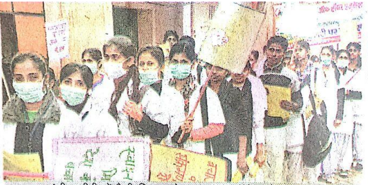
अग्रवाल मंडी टटीरी में रैली निकालते स्यादवाद कॉलेज के छात्र-छात्राएं।